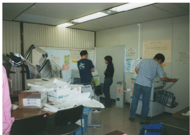
印刷風景 (飯田橋ボランティアセンターにて)