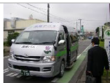
車両(ハイエース)購入約200万円

一般的に議員と執行部の議論は行われていますが、本会議等で議員同士の議論が行えないなど一般市民からの視点では不思議なルールがあります。議会基本条例は、活発化しているとはいえ現在の議会運営を活発にするための基本的な事項を定める条例です。何をするための議員で、何をするための議員定数か、何のための議会運営なのかを根本から考えるための仕組みを取り入れるため、本市議会にも議会基本条例設置に向けた勉強会が設置されます。