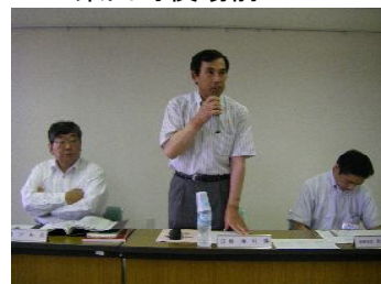
栗山町議会議員・事務局長さん