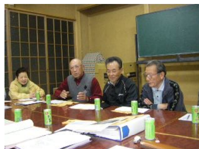
朝倉町2丁目自治会館(11/20)