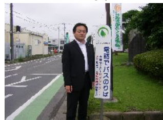
みどり市「電話でバス」停留所