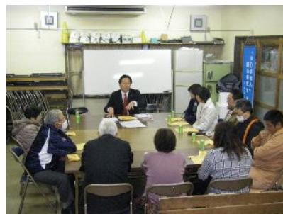
八幡町1丁目自治会館(11/19)