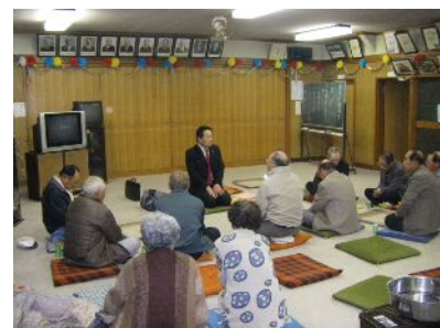
西新井町自治会館(11/29)