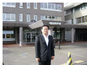
栗山町役場前にて