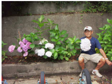
こんなに綺麗に咲いて ました。