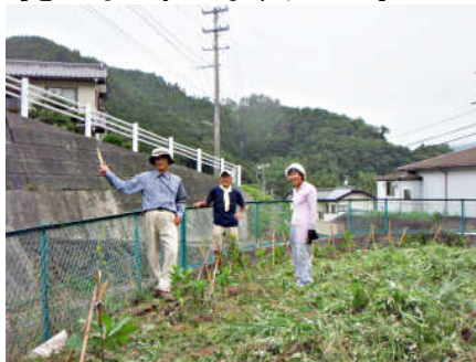
除草後： 5月に植えた苗が 見えるようになりました。