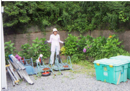
旧復興支援センター法面花壇 2ヶ月で雑草がいっぱい