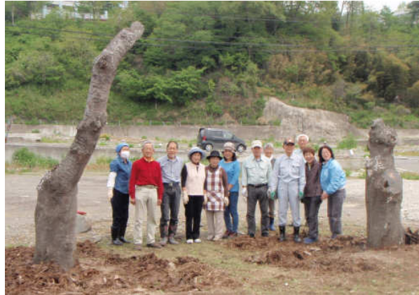
さくらたん最後の記念写真