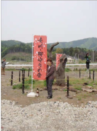
女川桜守りの会の幟