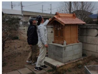
地蔵堂も製作予定