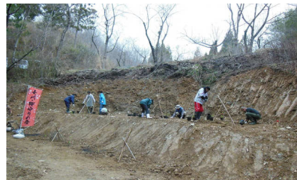
2013.4.6 学校林 桜広場への桜・アジサイ植栽