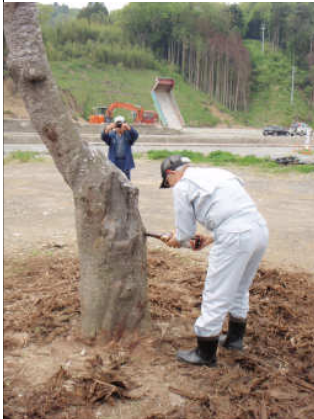
チェーンソーで根際を切断