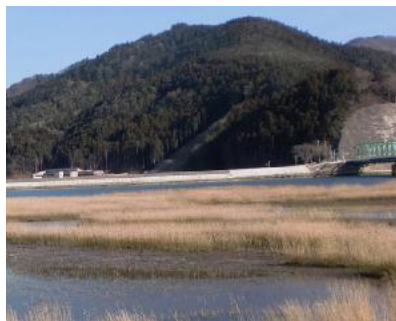
石巻市大川小学校(北上川対岸より)