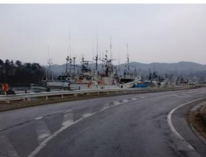
気仙沼港(漁船、右側は手付かずの棧橋・被災建物)