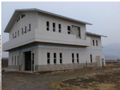
陸前高田市 浄化センター（下水処理場） 窒素除去を目的に新方式で設計された施設も被災