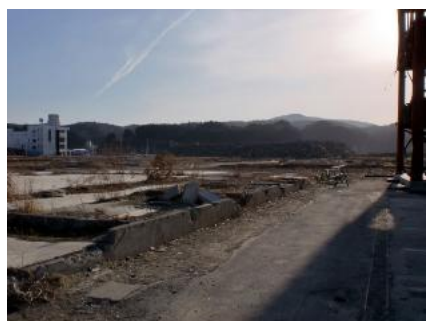
南三陸町(右端は防災対策庁舎)