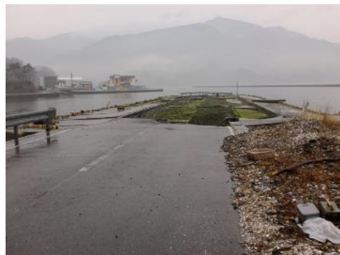
大船渡市 細浦 被災した船着き場