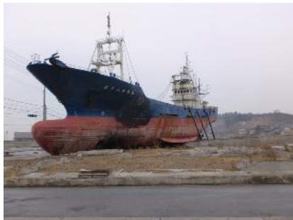
気仙沼市 第十八共徳丸(県道脇)