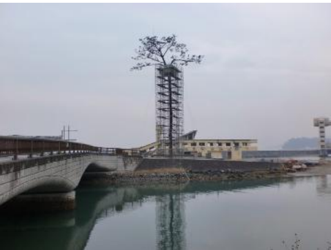
陸前高田市 奇跡の一本松