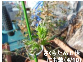
さくらたんⅡ世にも蕾(4/10)

女川の各地で切り土、盛り土の工事が始まりつつある。いよいよ苗畑の桜を定植できるようになりそう。