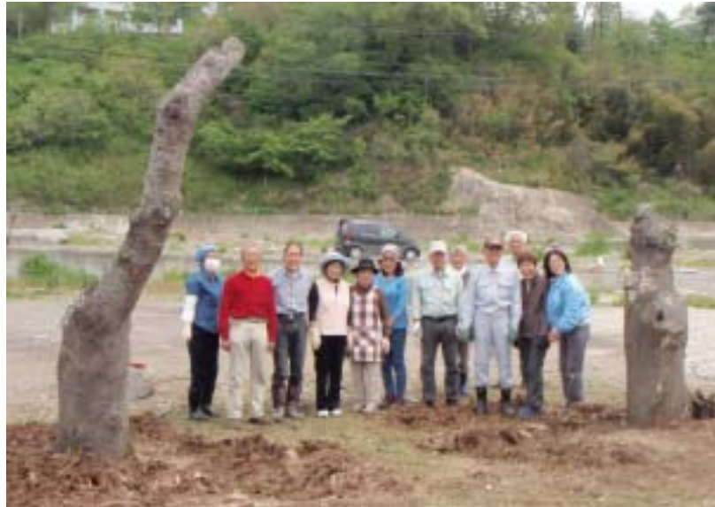
さくらたん最後の記念写真