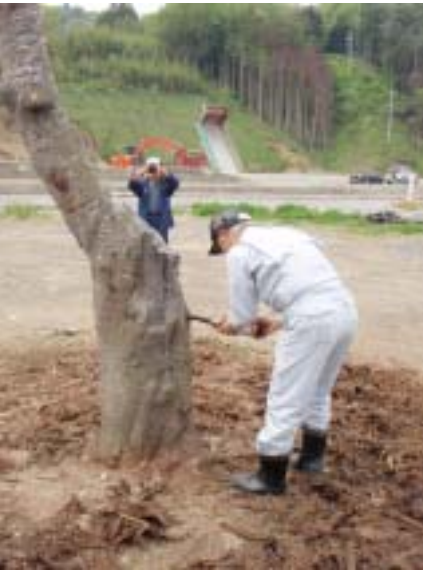
チェーンソーで根際を切断