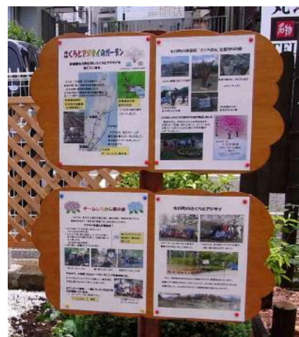
植替え・イルミネーション飾り付け(2012. 12. 1)