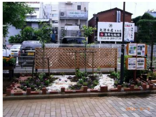
ガーデン作り(2012. 5. 26)