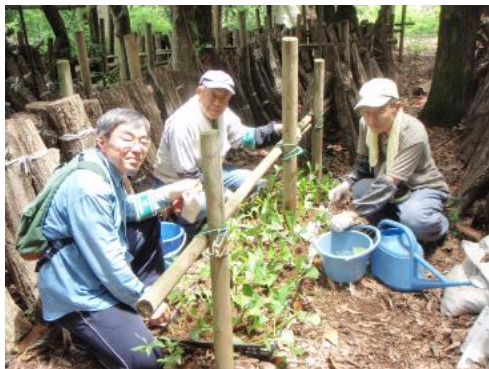
挿木(2012. 7. 27)